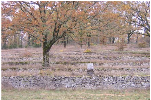
Les terrasses de St Pantaly.

Malgré ses activités prenantes, Bugeaud trouve le temps de revenir régulièrement dans son domaine et d'y essayer de nouvelles techniques dont une assez surprenante. Il commença par implanter des arbres fruitiers habituellement exploités en Méditerranée : des pêchers, figuiers, amandiers. Mais il acheta surtout 12 187 mûriers pour les cantons de Lanouaille et Excideuil !