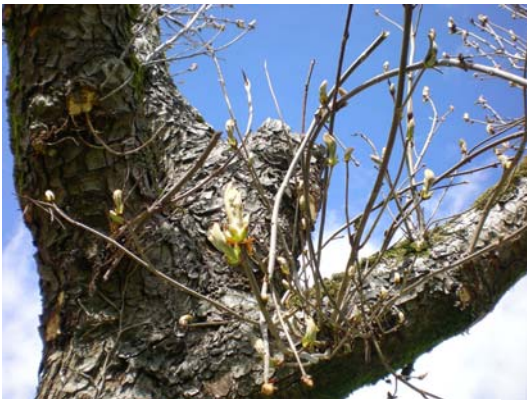
Un des mûriers de St Pantaly.

Bugeaud, incarnant l'avenir et le dynamisme du pays est élu maire d'Excideuil en 1825 et le restera jusqu'en 1830. C'est aussi cette année, le 8 septembre, qu'il réintègre l'armée.