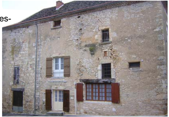
La magnanerie de St Pantaly d'Excideuil.

Ces professionnels fondent une magnanerie (où trônent encore deux majestueux mûriers platanes) et utilisent les terrasses de la Côte d'Or où sont plantés à l'époque 7547 mûriers. Mais les feuilles des ces arbres souffrent des gelées tardives du Périgord. De plus, la soie produite ne peut pas être transformée sur place, ce qui ajoute des coûts de transports.