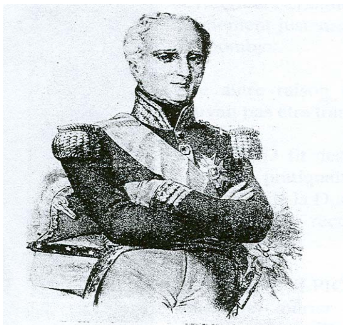
PL. XIV - LE MARÉCHAL BUGEAUD

Cousses et Rivières en Périgord Communauté de Communes