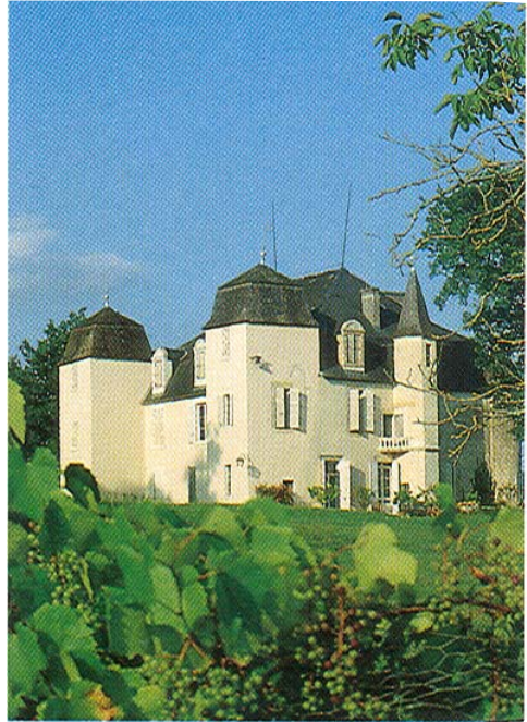
Château de la Roche qui fut racheté par Bugeaud.

Sa réussite agricole et commerciale est pourtant vue d'un mauvais œil par les paysans. Le soldat laboureur doit supporter les moqueries et les réflexions, parfois de la part de ses propres métayers.