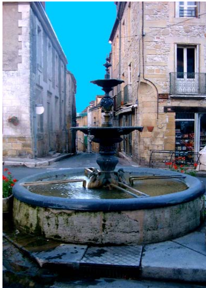
La fontaine d'Excideuil offerte à la ville par Bugeaud.

Il s'impose comme un homme politique reconnu, mais n'oublie pas pour autant sa région d'origine. Il reçoit 20 000 francs en 1833 en récompense de la garde de Marie-Caroline, duchesse de Berry. Cette somme, il la réinvestira entièrement dans la construction de deux fontaines : une à Excideuil (15 000 francs) et une autre à Lanouaille (5 000 francs).