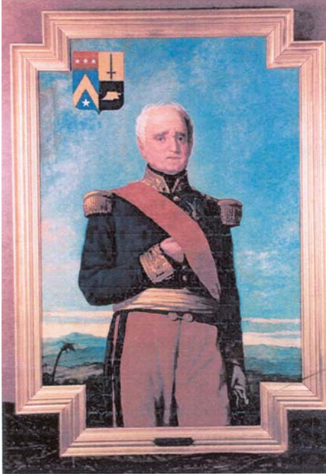
Le Maréchal Thomas Robert Bugeaud de la Piconnerie, duc d'Isly.