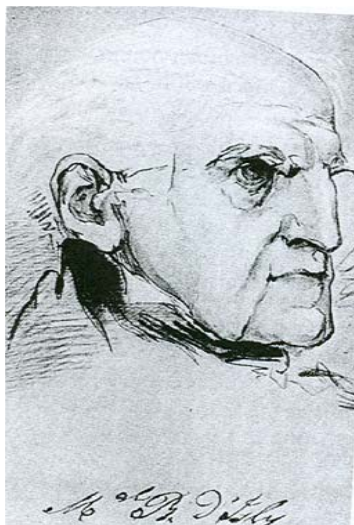
Portrait du maréchal Bugeaud.

Toujours à l'écoute de ses cantons, il demande la création en 1845 des relais de poste d'Excideuil et de Lanouaille. Son rôle majeur dans la campagne d'Algérie se termine le 28 janvier 1847, il rentre en France avec le grade de maréchal. Il réintègre aussitôt la Durantie et constate les bienfaits qu'il a apporté à la région. Mais les clubs socialistes se multiplient et prennent Bugeaud comme symbole d'une France rigide et dépassée. Malgré les progrès immenses qu'il a apporté, les paysans locaux accueillent le maréchal avec mépris.